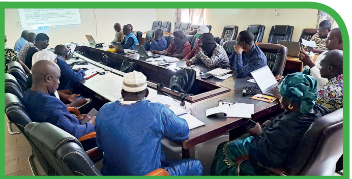
2 ème atelier trimestriel 2023 PMA SÉGOU

Dans le cadre de la Description des solutions d'irrigation pour le PARIIS Mali, le PARIIS Mali a signé un protocole d'accord de collaboration avec l'Association Malienne pour l'Irrigation et le Drainage (AMID) en vue de finaliser la description des solutions réalisées par les groupes de gestion de connaissance selon le canevas harmonisé élaboré par le CILSS. Une première version de la description des solutions d'irrigation a été partagée et fera l'objet de validation nationale au cours du premier atelier semestriel du GPCN prévue en début juillet 2023.