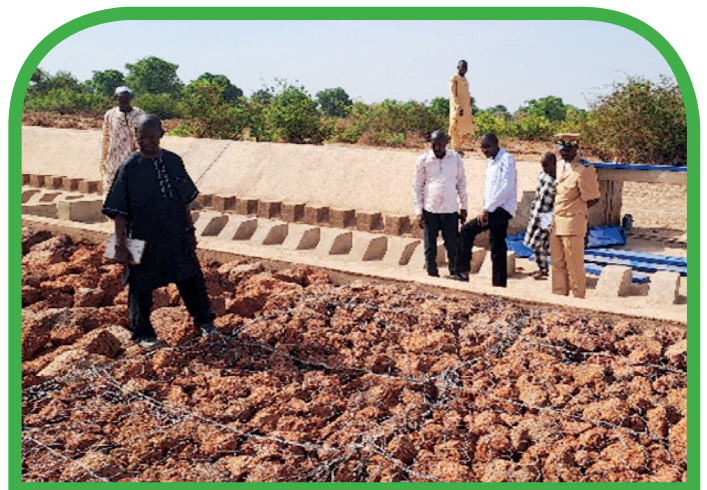
Bas-fond aménagé de Dioïla

A la fin des visites de terrain, un procès-verbal de réception provisoire a été élaboré et signé par les personnes habilitées pour chaque aménagement.