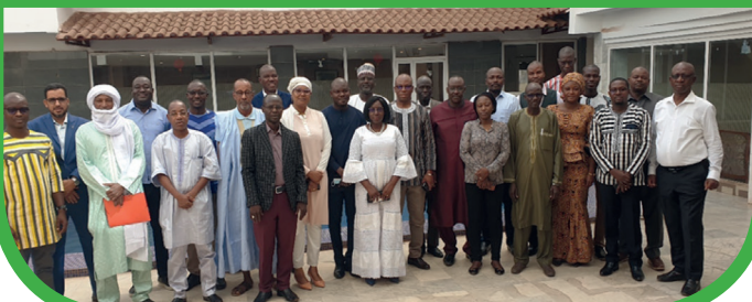
Photo des participants à l'atelier régional sur le SIREI à Bamako

L'atelier de formation visait à renforcer leur capacité sur le système d'information géographique (SIG), et permettre d'améliorer leur contribution dans l'alimentation des différents outils développés et/ou en cours de développement dans le cadre du SIREI, de la plateforme de Gestion des Connaissances et de l'outil de suivi évaluation.