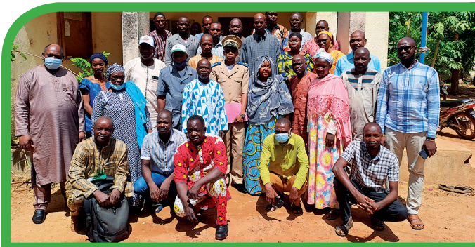
2 ème atelier trimestriel 2023 PMA Koulikoro

Les objectifs globaux de ces ateliers PMA étaient : (i) échanger sur l'état d'exécution et les modalités de mise en œuvre des activités du plan d'action des PMA ; (ii) valider les rapports d'activités réalisées par les PMA (Ateliers, Formations, Visites d'échanges d'expériences, Visites de travaux d'aménagements réalisés par le PARIIS Mali, Voyages d'études etc.) ; (iii) faire la revue des activités réalisées dans le cadre de la mise en œuvre des conventions signées avec les EAS, OSI et OPDL ; (iv) présenter et échanger sur les bonnes pratiques identifiées et les difficultés rencontrées dans la mise en œuvre des solutions d'irrigation et proposer des améliorations ; (v) échanger sur les résultats des études commanditées par le PARIIS Mali (Etude diagnostique sur les VBG réalisée dans la zone d'intervention du PARIIS Mali, Plan d'action VBG du PARIIS Mali, Documentation de deux solutions d'irrigation pour le PARIIS Mali selon la grille du PS ...).